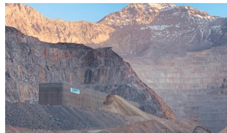
Construcción Muros TEM contra Avalanchas - Proyecto Traspaso Andina

Conpax , tras sus 36 años de vida, ha logrado en base a un real esfuerzo, desarrollo y constante mejora, consolidarse como un actor multiespecialista en la minería. Uno de sus más recientes éxitos, el muro TEM de protección de avalanchas para Codelco Andina, infraestructura de contención de nivel mundial y única en nuestra industria minera, desafío multidisciplinario que permite otorgar protección contra avalanchas y caídas de rocas en el sector del Nodo 3500 de la Mina Rajo, protegiendo a las personas y las instalaciones, fortaleciendo la